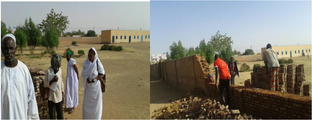
جانب من الانشطة في اعادة التاهيل والاعمار للمدارس