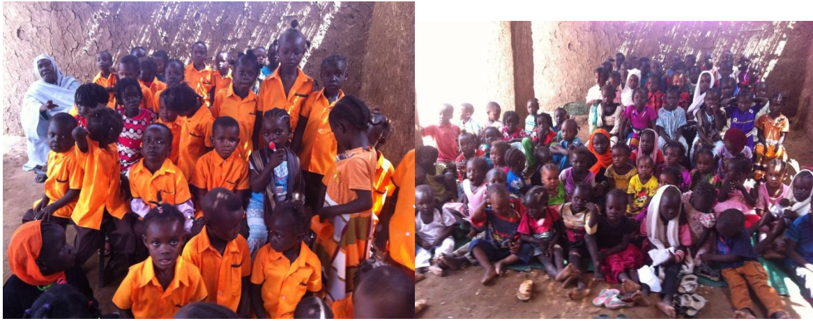
جانب من التعليم الموازي لاطفال النازحين (مستوى اول)