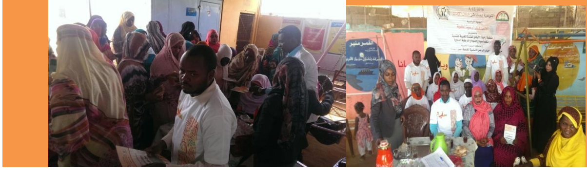
جانب من الورش التدريبية في حماية الطفل (التوعية بمخاطر ختان الاناث والزواج المبكر)