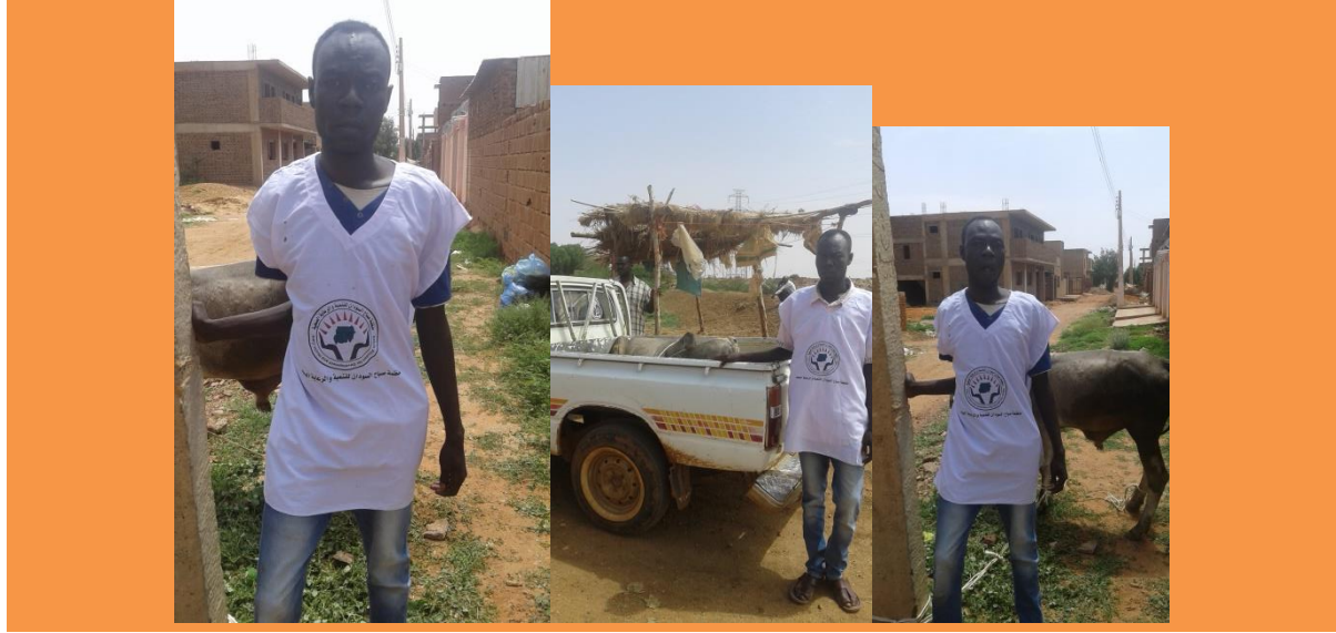
نموزج صورة رقم (11) توزيع لحوم الاضاحي