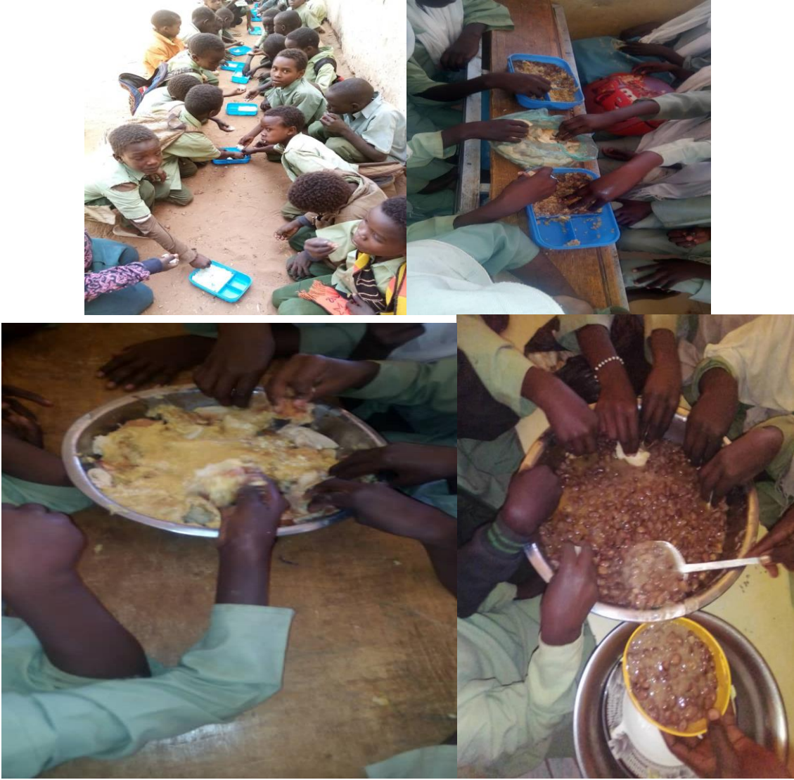
نموزج صورة رقم (6) حملة مناهضة العنف ضد الاطفال في المدارس للاساتذة والاطفال